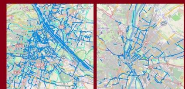
Bécs és Budapest kerékpáros úthálózata - azonos terület, közel azonos népesség - közel azonos népsűrűség