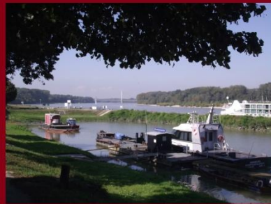
Hainburg an der Donau - kikötő