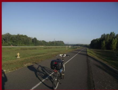
Pozsony felé a Duna gátján Szlovákiában