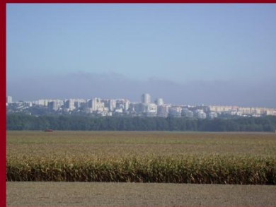
Pozsony - Károlyfalva: nekem nem tetszik