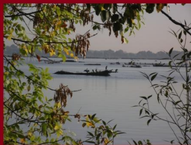
A dunacsúnyí duzzasztás (az elterelés előtt)