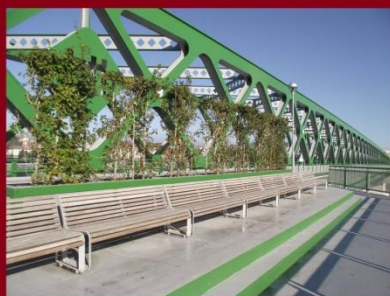
Kilátó - pihenőhely a Duna közepén az új Régi Híd-on Pozsonyban