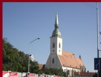
Pozsony, Szent Márton székesegyház