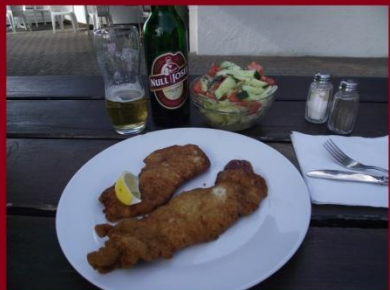
A bécsi Bécsiszelet salátával és alkoholmentes sörrel