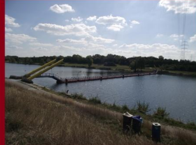
Gyalogoshíd a bécsi Dunaszigetre