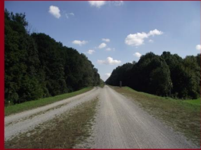
A murvás út is jó minőségű