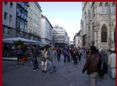
Itt éppen nem látszik, de nagy volt a tömeg