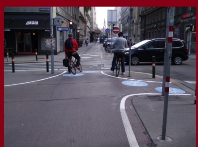
Jól jelölt és elválasztott járda, kerékpárút és úttest