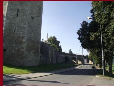
Hainburg an der Donau - dunapart