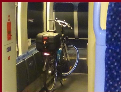
Útban Győr felé, majd átszállással Rajkára