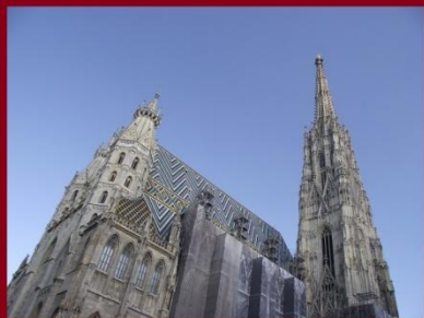
Bécs - Stephansdom