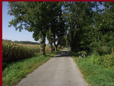
Bicikliút a fasorban