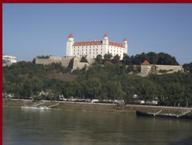
A pozsonyi vár