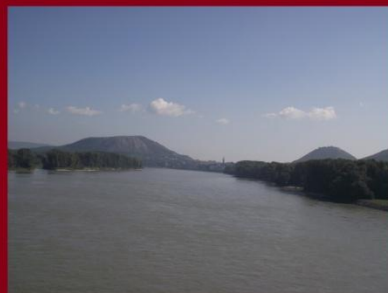
A hídról Hainburg an der Donau