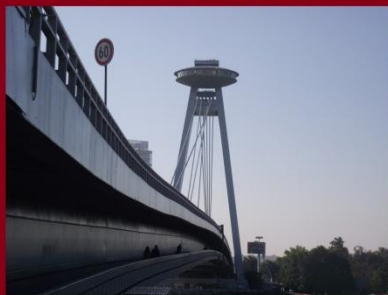
A Szlovák Nemzeti Felkészítés Hídja