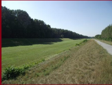
A gáton az árvízi meder mellett