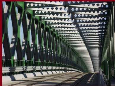
A Stary Most (Régi híd) most a legújabb pozsonyi Duna-híd, Idén adták át