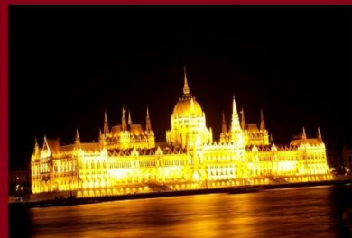
Hazafelé a Déli pályaudvarról