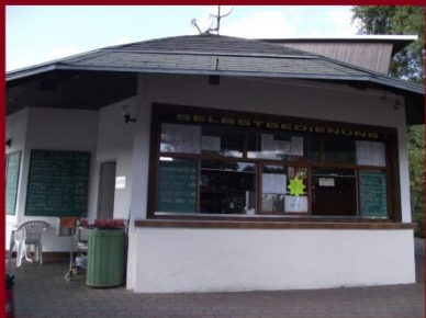
A MOSQUITO büfé a bécsi dunaparton