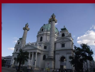
Bécs - Karlskirche