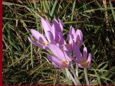
A gát oldalán őszi kikericsek tengere