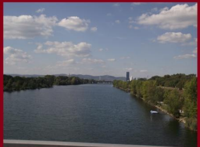
Átkelés a Duna Csatornán a Dunaszigetre