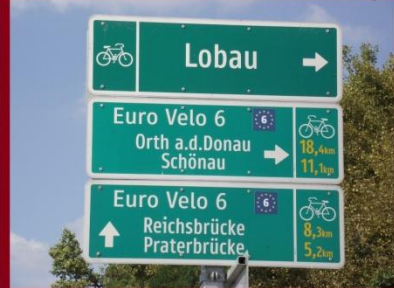
Osztrák pontosságú tájékoztató