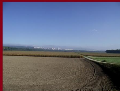
Pozsony - Károlyfalva: megapollisz épül?