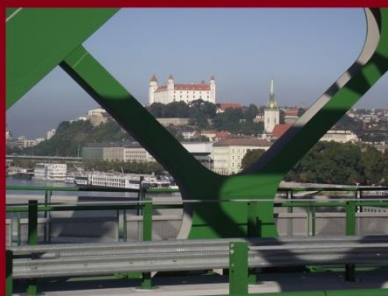
A pozsonyi vár és a Szent Márton székesegyház a hídról