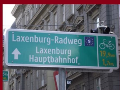
Már csak 1,7 km a Főpályaudvar