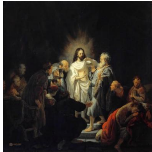
Rembrandt: Hitetlen Tamás (1634)